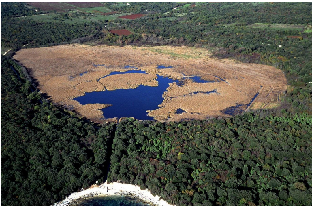
Palud iz zraka